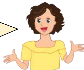
XX 醫院護士 張姑娘

在 2019 冠狀病毒病疫情防控期間，深圳市大力推廣「互聯網+醫療」服務。現時，深圳市多家醫院為市民提供線上諮詢服務，22 所醫院已獲得互聯網醫院牌照。此外，深圳市也鼓勵發展線上藥品配送、線上家庭醫生等服務，讓市民在家也能享受便捷高效的醫療服務。